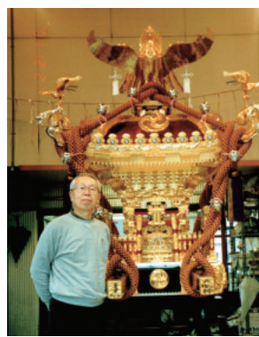
大きな神輿や仏像は、細かく分解してひとつずつの部品に金箔を貼っていくそう