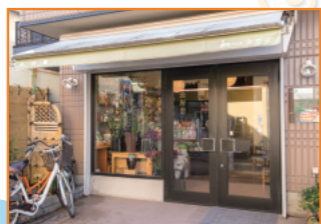
茶・和ショップみやこ