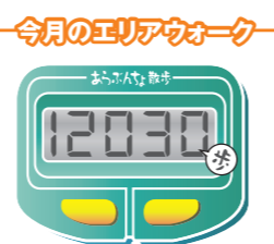
住宅街にもお店があり、散策しやすいあるエリア。公園でひなたぼっこも◎