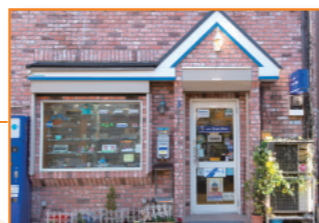
モデルラン・ブルー