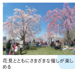
花見とともにさまざまな催しが楽しめる

第12回尾久の原シダレザクラ祭り 日時:4/4(土)10:00~15:00 ※雨天の場合、翌日に順延 会場:都立尾久の原公園 はらっぱ